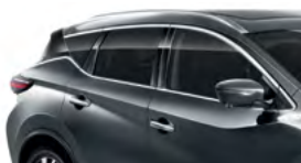
Темно-серый — KAD