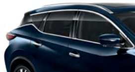
Темно-синий — RBG