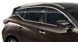
Серо-коричневый — CAM