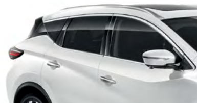
Белый перламутр — QAB