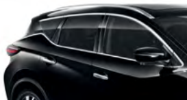
Черный — G41