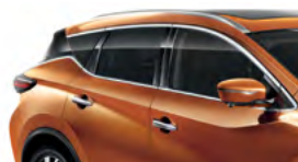
Оранжевый — EAW