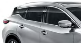
Серебристый — K23